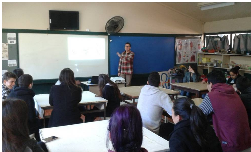
Figura 2. Bolsista realizando a apresentação.