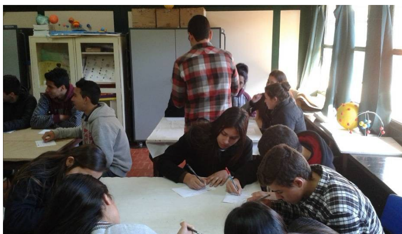
Figura 1. Alunos respondendo ao questionário.

Em um primeiro momento, os alunos foram convidados a responder um questionário (figura 1) e em seguida foi feita uma apresentação em (figura 2), abordando os seguintes tópicos: principais espécies da fauna do RS, animais presentes na lista de espécies da fauna gaúcha ameaçadas de extinção, principais ameaças e medidas de preservação. Os alunos se mostraram interessados pela apresentação e pelo tema, pois interagiram e fizeram perguntas.